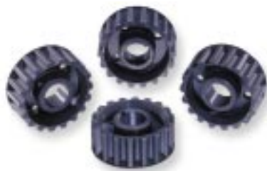
Tavola Table Planche Tafel

Serie puleggie distribuzione in ergal Set of light-alloy (ergal) timing belt rollers Jeu de poulies de distribution en ergal Satz Steuerriemenscheiben in Ergal